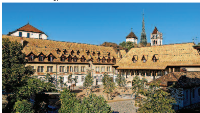
A Genfi Akadémia épülete