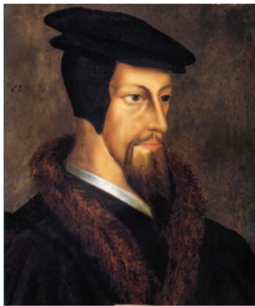
A fiatal Kálvin János (ismeretlen festő)

A magyarok számára Kálvin Jánosként ismert és sokak által magyar embernek tartott reformátor (eredeti nevén Jean Calvin) 1509. július 10-én született a franciaországi Noyonban, ahol édesapja a város jegyzője és a káptalan ügyvédje volt. Egyetemi tanulmányait a párizsi Sorbonne-on kezdte, ahol teológiát vagy bölcsészetet tanult, majd – apja kívánságának engedve – az orléans-i jogi egyetemen folytatta. Ugyanitt ismerkedett meg a lutheri reformáció eszméivel, amelyek aztán döntően meghatározták életútját. 1531–34 között Párizs, Orléans és Noyon, majd ismét Párizs életének a helyszínei, mígnem 1534 végén, I. Ferenc francia király protestánsellenes intézkedései miatt