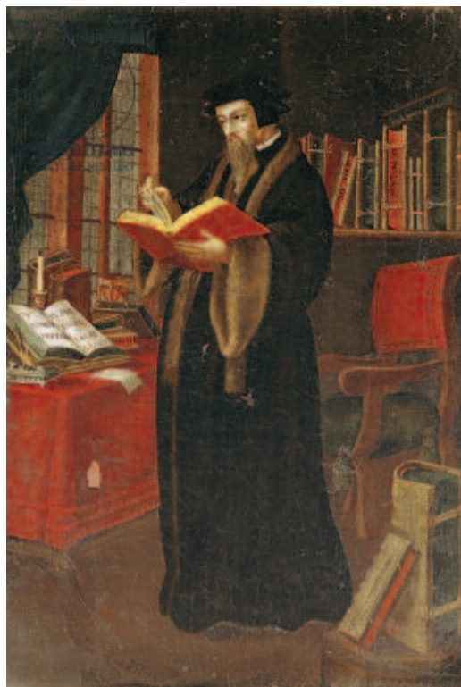
Kálvin János (ismeretlen festő)

1541-ben a hit dolgaiban tanácsalan és politikai zűrzavarban élő genfiak visszahívták száműzött prédikátorukat. Kálvin hosszas gondolkodás után szeptemberben visszatért Genfbe. Ebben a döntésében is Farel „dörgedelmei és villámai” – ahogyan Kálvin később fogalmaz – jelentették a végső érvt. Kálvin visszatérésekor kikötötte, hogy az egyház rendjét úgy formálhassa, ahogy Isten Igéje szerint helyesnek tartja. A megváltozott helyzetben a városi tanács elfogadta a korábban elutasított kálvini reformokat és az „Ordonances ecclesiastiques”-t (Egyházi rendtartások) 1541. november 20-án ünnepélyesen felolvasták, és közfelkiáltással elfogadták a Szent Péter-templomban. A városi tanács mellett létrejött a kilenc lelkészből és tizenkét világi tagból álló konzisztórium (egyháztanács): az egyházi hatalmat gyakorló testület. A gyülekezetben – újszövetségi mintára – négy tisztség működik: a lelkipásztoroké, a tani-