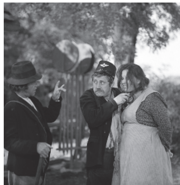
Indul a bakterház